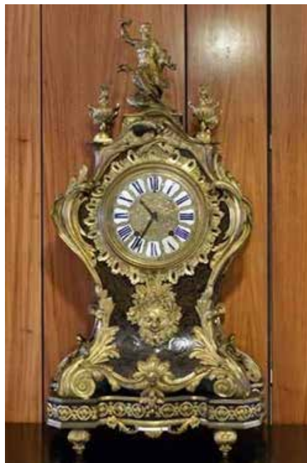
↳ Balthazar Martinot, pendule dite "de Brasilia", XVIIe siècle, détruite le 8 janvier dans le palais présidentiel du Planalto.

Bruxelles sera également mis à l'honneur. www.brightfestival.brussels ■ Du 10-02 au 12-03, la Gare Maritime de Tour & Taxis accueille la première édition de Sculptura , festival réunissant une bonne vingtaine de sculpteurs internationaux. www.sculpturafestival.be ■ Ouverte en 2015 à Bruxelles au numéro 68 de la place du Jeu de Balle, la galerie Marc Minjauw a quitté le quartier des Marolles et son marché aux puces à la mi-décembre 2022 pour rejoindre l'un des espaces de la nouvelle galerie Louise. Le lieu, donnant sur la place Stéphanie, a fait l'objet d'une rénovation récente, permettant d'accueillir la galerie sur une surface de 250 m 2 , avec six vitrines. www.mmgallery.be ■ Début décembre, le gouvernement bruxellois décidait d'octroyer une rallonge